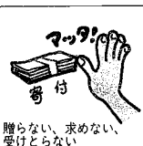
贈らない、求めない、受けとらない

政治家の親族が死亡した場合、選挙区内の人に對しての死亡広告を新聞に有料で掲載できますか。「会葬御礼(おんれ)」の広告はどうですか。答：単に事実を通知する死亡広告は差し支えありませんが、金銭御礼の広告はあきまつたところの広告として扱われるので、罰則をうけておられる場合があります。