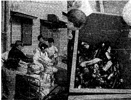
集められた古新聞・古雑誌とあきびん

5月18日から20日まで市体育館で「第1回ワールドチームカップ卓球新潟大会」が華やかに開催されました。大会には、男子4チーム(朝鮮民主主義人民共和国、韓国、ブラジル、アメリカ)、女子3チーム(朝鮮民主主義人民共和国、香港、ナイジェリア)が参加。観衆は、ブルーの卓球台やオレンジ色のボール、ワインカラーのコートマットなどのファッション的な演出と世界の一流選手のプレーを堪能していました。大会は新潟市のスポーツとくに卓球の振興と国際交流に大きな弾みとなりました。