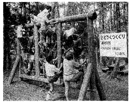
緑たっぷりの自然の中、思いっきり遊ぼう！

いよいよ春本番。心もからだも軽やかな季節を迎え、キャンプにハイキング、そして遊びに研修に行き先を探してはいる人も多いのではなしに、市ではこんな人たちのために、青少年三川自然の森津川一山の家、大畑少年センター、少年家を設けています。東蒲原郡三川村にある青少年三川自然の森は、森林浴自然観察キャンプ、ハイキングなどが楽しめる新潟市民の憩いの森。津川一山の家は、阿賀の清流を目の前に、鱒山や諏訪時に囲まれるなど、すばらしい環境に恵まれた宿泊施設です。