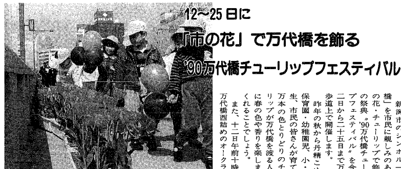
12~25日に「市の花」で万代橋を飾る 90万代橋チュールリップフェスティバル

殉職船員遺児に授産金を支給 外航船、旅客船、内航船の運航事業に従事殉職した船員の遺児で、生活に困窮している人に、高校卒業まで授産金を支給しています。 支給内容 1人月6,000円、入学祝い 問い合わせ 財団法人殉職船員顕彰会(☎03-234-0662)へ