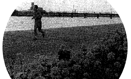
春風にそよぐ菜の花 信濃川のやすらぎ堤で菜の花が満開です。昨年10月に種をまいてからスクスクと育ち、春風に黄色い花を心地よさそうにびかせています。