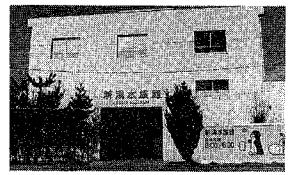
3月末で閉館する市水族館

開館市水族館が三月いっぱい、今年夏に閉館する新水族館へようこそ。この水族館「マリニピア日本海」の歴史は、閉館を打つことになり... (text continues)