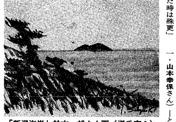
「新潟海岸」鈴木一郎さん画(沼垂東6)