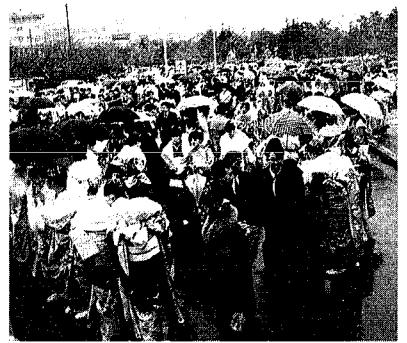
昨年の式典会場前

市内の新成人は男女合わせて六千八百八人。十二月一日現在、新潟市に住民登録してある方たちへは当日の案内を、年賀状で差し上げますが、大学進学などで新潟市を離れて迎える方は、案内状がなくても参加できます。 会場周辺は一方通行 市体育館 市サブグラウンド 市陸上競技場 黒民会館 駐車場