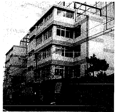
完成間近な大畑少年センター

少年の自由な遊び場 宿泊 研修の場 国際交流の場として市で初の施設 大畑少年センターが、一月十八日の完成を前に、二十五日から利用し込みを開始します。