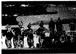
全国民謡大会民謡の部で2年連続優勝を飾った新潟民謡愛好会