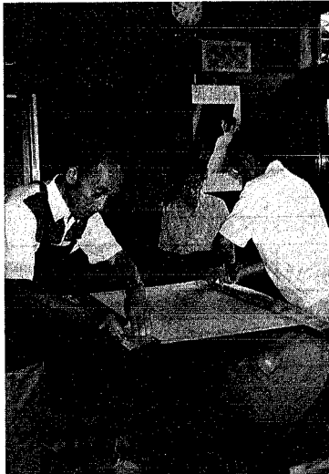
9月15日には敬老奉仕を行いました

来年は一九九〇年、二十一世紀も開きます。正月放映の、市役所跡地開発、鳥屋野新春市政テレビ番組「クイズで知る新潟市」(仮題)新まぎま新聞を紹介し、クイズに答えながら私たちの未来を見つめていく番組です。市広報では、このクイズ番組に出演する解答者を募集します。出演資格は一九九〇年の(年)五、または千支(支)の(年)五、または(馬)にちなんだエピソードをお持ちの方。たとえば番地が九十九番地、新潟市に居を構えて九十九カ月など、家族が乗馬が趣味、氏名に、馬が使われていたなど、関係があればなんでも応募できます。応募方法 十一月二十日(必着)までにチーム四人までで編成がき、住所氏名、年齢、電話番号、住所氏名、年輪、電話帳(千951学)を書き、広報課(千951学)校町通一六〇二一、〇二2612144)へ。