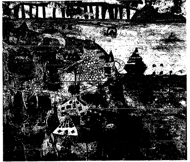
「未来の新潟」 佐渡までの橋を磁石で動く車が走るよ。空とぶ自転車は雲の上、潜水艇で魚とも仲よし。木のマンションやつぼマンションでは、すきな料理の名前をいうと、すぐにテーブルから出てくるよ。 (真砂小学校・2年3組)