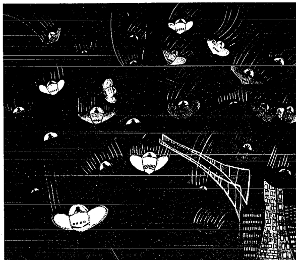
「50年後はエアカーで!!」 きれいな越佐大橋を下に見ながら日曜日にはみんなで思い思いの美しい色のエアカーで、夢いっぱい空中公園へみんなで出かけたい。ほくたちの夢は空へ空へ、宇宙へと広がる。 (新潟豊学校・小学部5・6年)