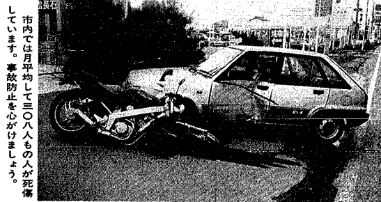
交通事故発生状況(1~9月)

市制100周年を記念し、住民参加で行われる「市民綱引き大会」の地区別と予選会の日程が決まりました。内容は別表のとおりです。100周年事業の中でも一