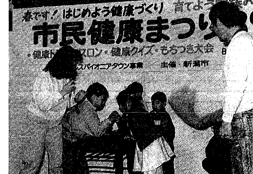
楽しい催し物を通して健康の大切さを知ってもらいます

すこやか高齢者講習会(2日コース) 日時 10月17、24日午前10時～午後2時 会場 鍼灸マッサージ会館(幸西1) 内容 講演「東洋医学と健康、はり灸マッサージについて」と健康相談 申し込み 電話で西保健所へ