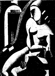
矢部支術「操場」1823-24年 富岡美術館蔵(第一部歴史編出品)

たつては、部長が村画を策定し、戸長(村長)が村画に諮問するという形をとった。村々では示された案について議論が出、意見はなかなかまとまらなかった。しかし、同十月、部長は戸長・村総代の意見を付して、県へ答申を提出した。示された案で合併するもの、新村名でもめた村も多かった。市町制施行手続に「新町名選定手続」の世が示されていて、大町村の名を組み合わせた、複数の村名を組み合わせたか、歴史に由来する名称を採ったかどれかを書けと示している。二番目の方法によった村も多かった。例えば日本岡村。一日市・本所・岡山・中興野・石動新田の五か村の合併した村のうち大村、曾川、