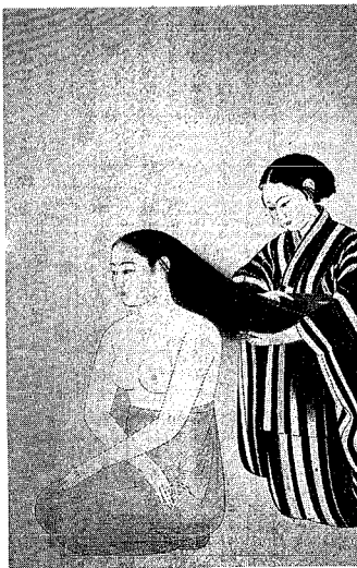
小林古徑「髪」1931年 水青文庫蔵(第一部歴史編出品)

今年一〇〇歳を迎える新潟市、いろいろな出来事などを経験してきた多難の世紀を、また、数々の栄光らした一世紀をも生み出した一世紀でもあります。