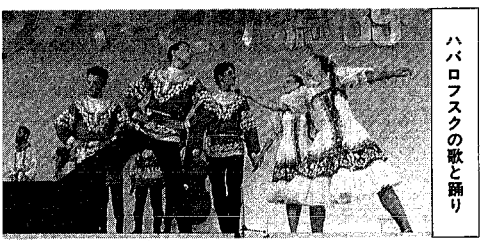
ハバロフスクの歌と踊り