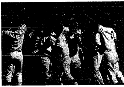
大逆転劇で甲子園へのキップを手に入れ 喜びにわく選手たち