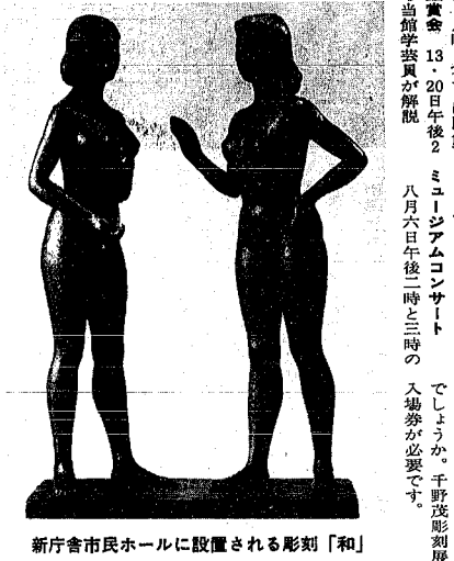
新庁舎市民ホールに設置される彫刻「和」