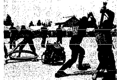
消防操法大会の様子が写っています。

地域の防災の大きな支えとなる消防団。七月二十三日、消防団員の技術向上と、三気高揚のため恒例の消防操法大会が開催された。