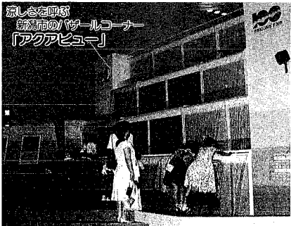
涼しさを呼ぶ新満市のパザールコーナー「アクアビュー」

ナイスふ〜ど新満'89は連日大盛況。人気のパビリオンやプレイングの大観覧車、ジェットコースターなどは順番待ちの長い列ができるほど、そんな中でひと息つけるのは、冷房が良く効いたパザール館。その中でもひと際涼しいのが新満市パザールコーナー「アクアビュー」。滝や壁を流れる水が清涼感を引きだしています。訪れた人たちは手を差し出したリ、スクリーンに映る「水の都 新満」を眺めたり、しばしの暑さを忘れよう、でも、館内のパザール品を前にしておみやげ選び、また熱くなりそうです。