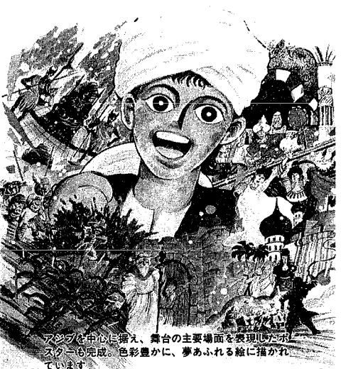
アジブを中心に据え、舞台の主要場面を表現したポスターも完成。色豊かに、夢あふれる絵に描かれています。

市制100周年を記念してミュージカル「アジブの扉」です。二カ月後の九月二十三、二十四日に三回公演される市民に、いよいよ発売開始となり、カルの公演としては四回目で