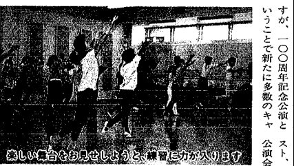
親子の心を合わせようと、練習に力が入ります。

夏は風物詩はいろいろありますが、お祭りから子どもと一緒に楽しむ、出来るもののひとつにラジオ体操があります。市と郵政省では、新潟市制100周年記念として、NHK夏期巡回ラジオ体操会を八月十一日に行います。会場は市陸上競技場。朝霧に濡れた緑の芝を踏み、さわやかな一日の朝開けを親子、友達同士で参加してみませんか。日時 八月十一日午前四時十五分～六時開会式。会場 市陸上競技場。小雨実施。雨天の場合は市体育館。問い合わせ 市体育課(内線672番)へ