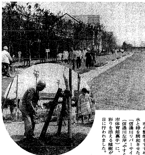
21世紀に向けた 緑豊かな街づくりに若杉市長も植樹

市が整備をすすめている、水と緑を調和させた緑地の「信濃川リバーサイド緑地」(信濃川左岸)やすらぎ堤、市庁前(新橋)に、桜と花の彩りを添える植樹が今月十三日に行われました。