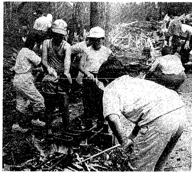
炊けたかなあ、どうかかな...どれ見せてみろ!