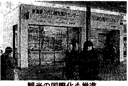
観光の国際化も推進

観光の国際化も推進 国際観光の推進では、外国人観光客の誘致を図るため英語版の市内観光紹介ビデオを制作します。