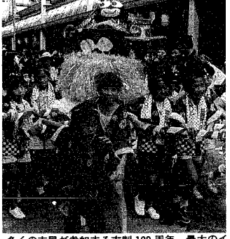
多くの市民が参加する市制100周年、最大のイベント「新潟まつり」