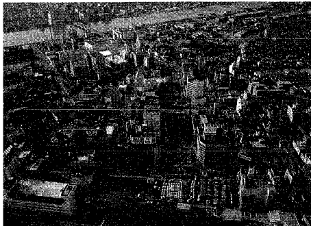
市民ニーズを取り入れた都市計画調査が続々と...