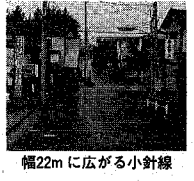
幅22mに広がる小針線

駅前開発の推進には、プラカ三階の駅南口第一地区市街地再開発事業(組合施行)に三億一千六百万円の助成、第二地区市街地再開発事業(組合施行)に一億四千万円の助成を計上しています。