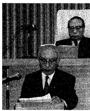
3月議会で施政方針演説を述べる若杉市長