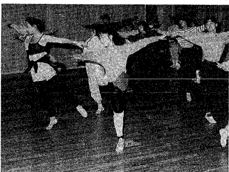
子どもたちからお年寄りまで、多くの市民から楽しく鑑賞してもらえ舞台を目指し、一生懸命に練習しています (写真はダンスの練習風景)