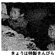
きょうは特製きんぴら