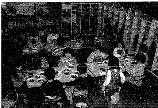
「いただきます」みんなで食べる給食はおいしいよ (中野山保育園)

最近、かむ力が弱くて食べ物をかみきれない、歯ごたえのあるものだと堅い、食べにくいという子どもたちが増えてきています。このような原因としては、離乳食期のころから問題があるようです。