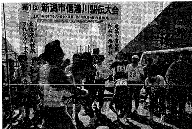
春に向かって走る信濃川駅伝大会(写真は昨年の大会)