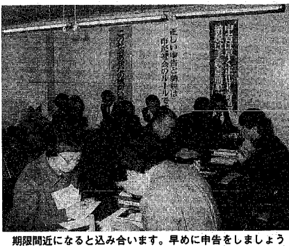
期間近になると込み合います。早めに申告をしましょう