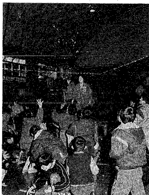
学年ごとに行われた豆まきでは、大畑小の上級生が卓球台の上から大きな声で「福は～うち 鬼は～そと」