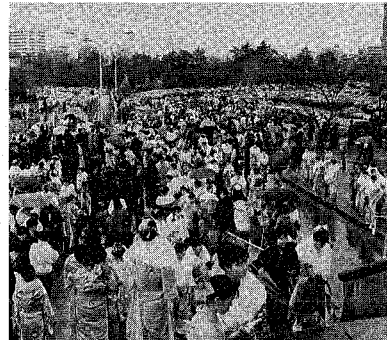
1月15日に行われる「成人の日のことい」(写真は昨年の式典会場前)

市では、今年も一月十五日に「成人の日」といふ期を、成人式を迎えたい方は案内状を届けてください。成人式は、成人の日(1月15日)の前日(1月14日)に、市内の新成人は男女合わせ六千八百五十五人、十月一日現在、新潟市に住民登録している方からは当日の案内状を届けてください。 会場は、市体育館、昭和三十二年四月二日から四十四年四月一日の間、成人式を営む方は案内状を届けてください。成人式は、成人の日(1月15日)の前日(1月14日)に、市内の新成人は男女合わせ六千八百五十五人、十月一日現在、新潟市に住民登録している方からは当日の案内状を届けてください。