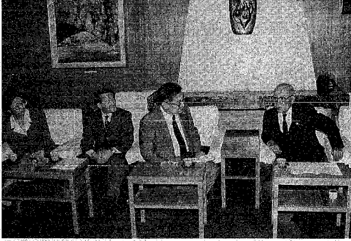
「新潟国際友好市民の会」設立発起人の代表らが若杉市長を訪問