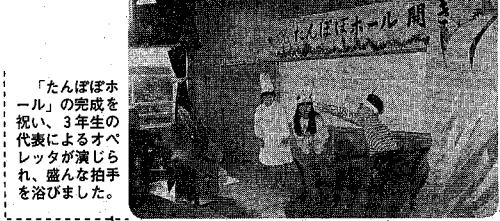
「たんぽぽホール」の完成を祝う、3年生の代表が演説を述べ、盛り込んだ拍手を浴びました。