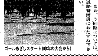
ゴールめざしスタート(昨年の大会から)

選手の内訳は、男性が二千八百八十三人、女性二百七十九人。年齢別では、十八歳から二十五歳が千五百四十八人、二十六歳から三十五歳が千四百五十八人、三十六歳以上百五十三人。最高齢者は十歳に出場する。男子は九十一歳、女子は七十八歳。午後七時五十分、五時(百二十二)に午後零時十五