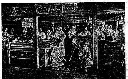
明治時代の料理学校(東京)

「ライスカルレーが食卓に上るのは明治後半からである。当時のライスカルレーは、当時のライスカルレーの調理法をお目にかける。最後に、当時のライスカルレーの調理法をお目にかける。 ライスカルレーが食卓に上るのは明治後半からである。当時のライスカルレーは、当時のライスカルレーの調理法をお目にかける。