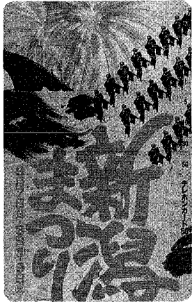
まつりポスターと同じデザインのテレホンカード

もうすぐ新潟まつりです。三万人の踊り子でうずまき大民謡流し、技と美の芸術信濃川花火大会、古式ゆかしい住吉行列、華やかな山車行列、勇壮な万代太鼓、