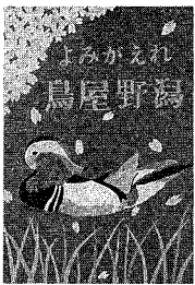
「鳥屋野濁浄化ポスター」