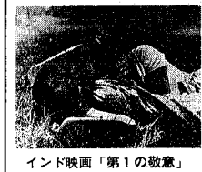
インド映画「第1の敬慕」

から感謝とお礼を申し上げ ます。 人種、風俗習慣、言語、 国民性の違いなどが生じ た各国選手団との楽しいハ