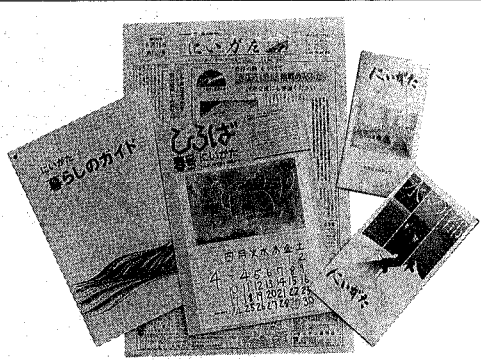
新潟市が発行している情報誌「新」

春の賑わいシーズンも一段落が掲載されています。毎週日曜日刊行新聞(新潟日報)の朝刊に折り込みで、家庭によりか。市では皆さんに新潟市より良く知っていただくために、いろいろな情報誌(紙)を発行しています。「市報にいがた」：市政のニュースやトピックス、催しやイベントの案内、そして保健所からのお知らせなどが掲載されています。毎週一回発行し郵送でお届けしています。「ひろば」にいがた：市民の皆さんの声を盛り込みながら、市政、地域そして身近なことなどいろいろな話題を追っての冊子で年一回の発行です。暮らしの常生活に開眼の深き日々の仕事、窓の内側など掲載してあります。市民生活の手引き書としてお使いください。問い合わせは「ひろば」にいがた：「水の都にいがた」にいがた：観光ガイドブック。写真やイラストで新潟の景色が載っています。ご希望の方は商業観光課または広報課へ。英語、ロシア語、中国語の地図版や制作した新潟市の紹介ビデオも用意されています。外国人観光客に役立つ外国の友に知ってもらいたく、皆さんの語学学習や外国企業内する時などに役立てて下さい。申し込みは合わせては広報課へ。