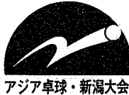
アジア卓球・新潟大会

今年秋のソウルオリンピックの開幕戦ともなり、世界トップクラスの選手たちが文字どおり、世界の覇ををかけて競うこの大会、きょう十五日に開幕します。