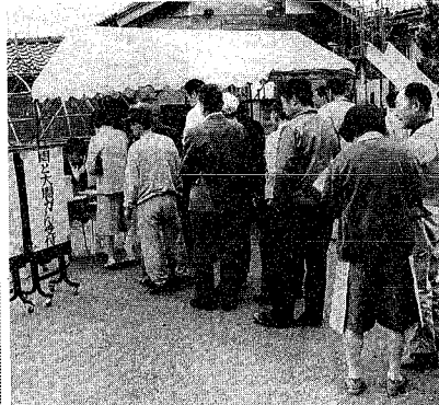
胃がん検診を受ける市民。胃がん検診は、初期発見で早期治療が可能で、死亡率は全国平均とほぼ同じですが、市民医師会の努力で、胃がんの発見率は全国平均の二倍です。

40歳を過ぎたら胃がん検診を早期発見で早期治療 胃がんは、検診による集団胃がん検診を四月から十一月まで実施します。昭和六十一年中に市内で七百七十一人ががんで死んでいますが、このうち、男性の約二六％、女性の約三三％が胃がんで亡くなっています。胃がんは、初期のうちには自覚症状がなく、全く気がつかないことが多いのですが、早期発見で早期治療で完全に治すことができます。四十歳を過ぎたら、ぜひ一回は定期胃がん検診を受けましょう。 胃がんは、初期のうちには自覚症状がなく、全く気がつかないことが多いのですが、早期発見で早期治療で完全に治すことができます。四十歳を過ぎたら、ぜひ一回は定期胃がん検診を受けましょう。