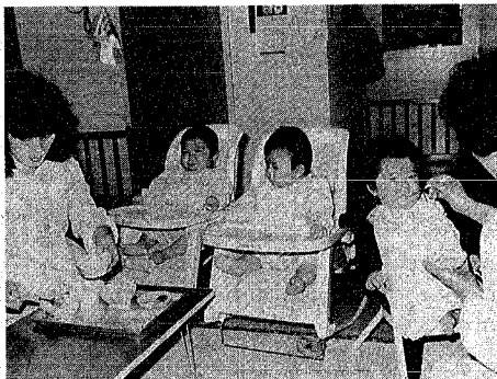
楽しい食事の時間(宮浦乳児保育園のゼロ歳児保育)

市立保育園では昨年五月から流産場、八千代、白山の各保育園で生後六月以上の乳児を対象に、また宮浦乳児保育園では生後三月以上の乳児を対象に、それぞれゼロ歳児保育を実施してきました。今年五月からはこれらに加え、牧島、ロータリー、坂井育きまな生後六月以上の乳児を対象に、それぞれゼロ歳児保育を実施します。 入園の申請は次の要領で行います。 受付期間 四月四日(同)九日 入園資格 保護者のいずれもが、そのほかの理由で保育園に入園できない生後六月以上の乳児を対象に、それぞれゼロ歳児保育を実施します。 入園料 園児と同一世帯で生計をともにしている養育者(父、母、祖父、祖母、兄、姉など)の所得税などの課税額を合計し、そのほかの理由で入園できない生後六月以上の乳児を対象に、それぞれゼロ歳児保育を実施します。 入園料 園児と同一世帯で生計をともにしている養育者(父、母、祖父、祖母、兄、姉など)の所得税などの課税額を合計し、そのほかの理由で入園できない生後六月以上の乳児を対象に、それぞれゼロ歳児保育を実施します。