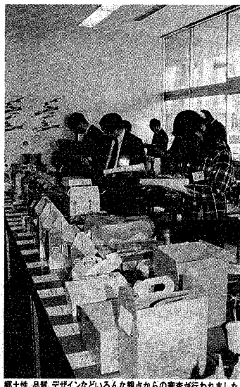
郷土性、品質、デザインなどいろんな観点からの審査が行われました。