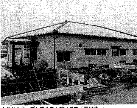
4月からオープンする老人憩いの家「両川荘」

お年寄りの趣味やだらんのための施設、老人憩いの家。お年寄りの趣味やだらんのための施設、老人憩いの家の名称は、両川荘と新崎荘です。これにより、市内の老人憩いの家は、老人福祉センター「しあわせ荘」などを含めて二十八施設になります。 四月から開所する新しい老人憩いの家は、両川荘と新崎荘です。これにより、市内の老人憩いの家は、老人福祉センター「しあわせ荘」などを含めて二十八施設になります。 内部は、二十四畳の和室と十六畳の和室、軽作業や民謡ができるように畳の取り外しが簡単な十六畳の和室浴室を備えています。 市では、現在開会中の三月定例会に、六十三年度も三カ所の老人憩いの家の新設を提案しています。