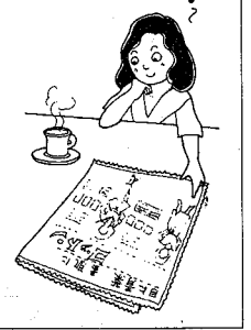
ルンルン気分も慎重に

カタログだけが頼りの通信販売。注文は慎重に。品が手に入る通信販売は、ますます多く利用されている。しかし、注文の手帳から、思わぬ落とし穴がみつかる。