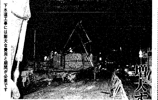
下水道工事には膨大な費用と期間が必要で、

市内の主要な工場、事業所五百社から六十年度に約八十一万トンが排出されました。廃棄物のうち、脱衣、焼却などの中間処理されたもの約六十二万トン、再生利用されたもの約十七万トン、埋め立て最終処分されたもの約七万トンです。市内の最終処分場の埋め立て可能な容量は、約二十九万立方メートルと少ないうえ、現状です。このほか、市では再生利用の推進も行っています。