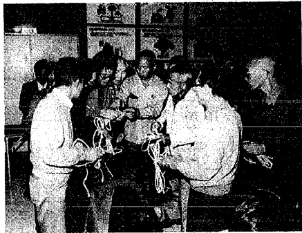
ワラッチ作り挑戦する皆さん