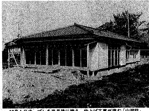
12月1日オープンを半月後に控え、仕上げ工事が進む「山瀧荘」

新しい老人憩いの家の名称、中央公園の隣「寺尾荘」三丁目「山瀧荘」と「寺尾荘」で、一七二二(三)です。所在地は「山瀧荘」が県道沿い、いずれも木造平家建て、野木・一日市線沿い(長瀬八、業費は二施設で九百三十万二千九百一十円)、「寺尾荘」が寺尾、四丁です。延べ床面積はそれぞれ二、二八六施設になります。