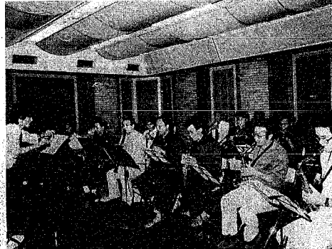
完全通音で、遠慮なく演奏できます

ミニコンサートなどを目的に、この中にもう一つ部屋があるよ使用、年々増えている練習室。この練習室は、大音量を発する利用、緩和が図られるものと、音楽空間関係から選ばれて、新しいスタジオ風練習室は、旧道場の大練習室を二分したうの半分を改造したもの、で、広さは六十五平方メートル、床式は二重通音機と部屋