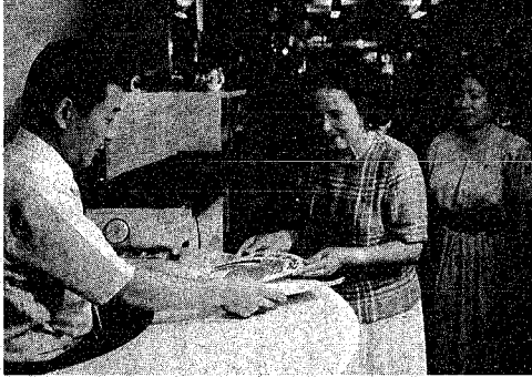
ゲーム場の店長に、「協力店」の看板を手渡す2人の指導員たち

市内の大型ゲーム場、書店、たばこ店などに、青少年を非行から守る店の協力を求めることになり、今月十日から本格的な依頼活動を開始しました。これは、少年非行の入口であり、中心となっている万引の未然防止と、指導活動の円滑化のため行われ、協