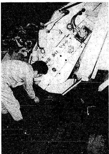
収集車もごみを焼却炉に入れる前には水切り、をします

ごみがドサツと待っています。野菜が店頭にカラフルに並べられて、これからは時節柄、このパティンがどちらの家庭でも繰り出されるのではなからう。出盛りのスイカ、メロン、トウモロコシ、枝豆など、わが家の食卓を楽しくしてくれます。当然翌日は、かさばる生ゴミに集められたごみの行方を探ってみたい。