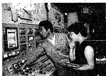
焼却炉はボタン操作で運転されています