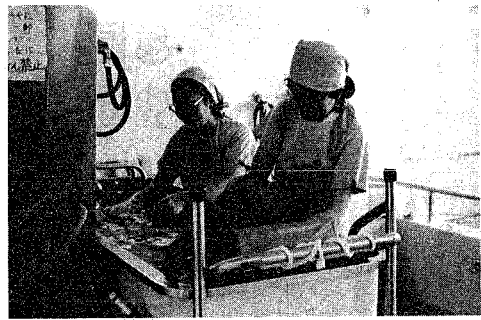
特殊浴槽での入浴サービス(有明園で)

市では、市制百周年記念行事・事業のアイデアを次の要領で募集しています。皆さんがアイデアをお寄せ下さい。応募資格 市民および市内への通勤通学者。募集期間 次の中から選んで下さい。所定の応募用紙は各提出先にあります。